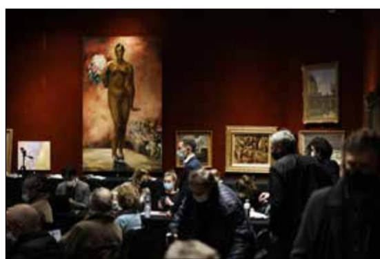
Jean de BOTTON (1898-1978), Portrait en pied de Joséphine Baker, 1931. Huile sur toile. Adjudgé 179 200 € le 19/11/21.

de l'équipe et le suivi personnalisé mis en place au fil des années font toute la force et la singularité de cette maison de ventes sur le marché français. Installée rue Favart, à proximité de l'Hôtel Drouot, l'étude se déploie aussi dans le 16 e arrondissement parisien, à Neuilly et en régions, où sont organisées de nombreuses journées d'expertises pour renforcer le contact direct avec ses vendeurs et s'ouvrir à un nouveau public.