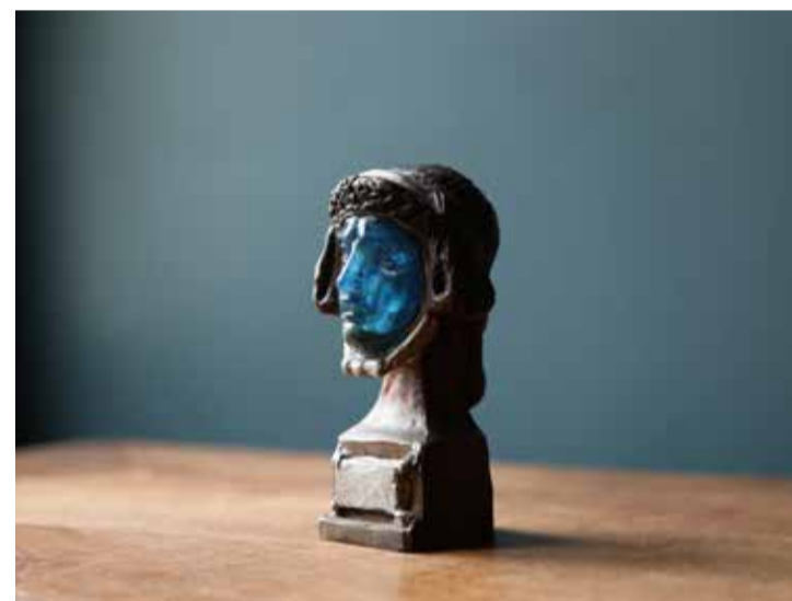
Jean-Léon GÉRÔME (1824-1904) – René LALIQUE (1860-1945), Tête antiquisante. Bronze à patine médaille et peinture argent et visage en verre bleu. H : 12 cm. Adjugé 38 400 € le 17/12/21