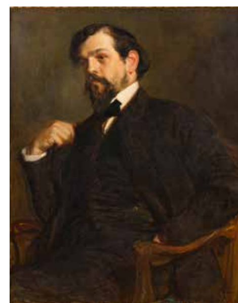
Jacques-Émile BLANCHE (1861-1942), Portrait de Claude Debussy , 1902. Adjudgé 281 600 € le 12 /10/21 - préempté par la Cité de de la Musique - Philharmonie de Paris