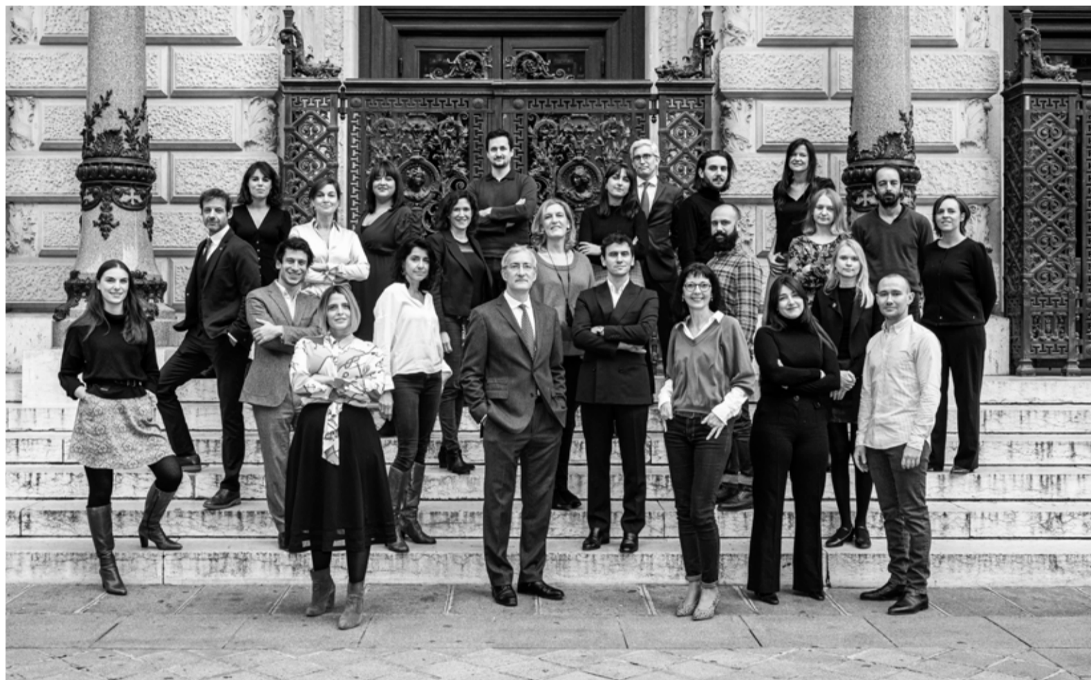
Le groupe Ader devant l'Opéra Comique

En 2021, la maison de ventes Ader enregistre un montant record d'adjudication de 40 millions d'euros, soit un taux de progression de + 25 % par rapport à l'année précédente. L'étude se démarque grâce à une organisation pensée autour de spécialités fortes, défendues par des experts référents, et une sélection de lots faite avec soin. Toujours plus performante, Ader comptabilise 90 ventes organisées en 2021, 20 000