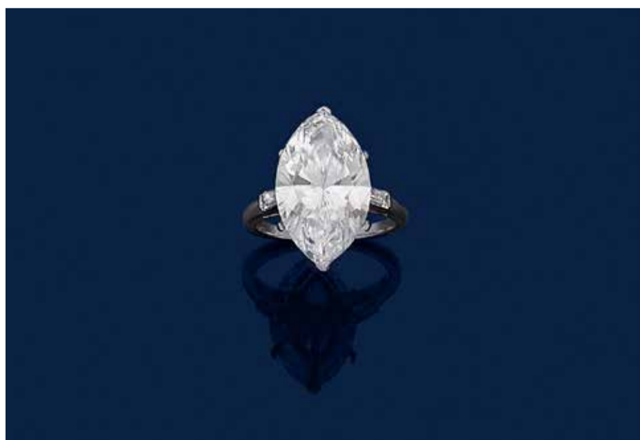
Bague en platine sertie d'un diamant navette pesant 8,87 carats épaulé de deux diamants baguettes - Poids brut : 5,3 g. Adjugé 422 400 € le 23/11/2021

Reconnue pour ses performances dans l'art du papier, la maison de ventes Ader proposait cette année des estampes de Pierre Soulages, vendues pour certaines près de 40 000 € établissant alors 6 nouveaux records. Retenons également dans cette spécialité un collage du Corbusier, réhaussé de gouache et d'encre adjugé 89 600 €, ainsi qu'un visage de femme au fusain par Henri Matisse vendu 136 966 €.