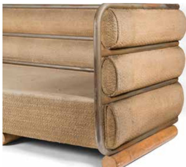
JEAN PASCAUD (1903-1996), Rare canapé moderniste à trois places. Adjugé 64 000 € le 03/12/21