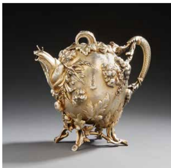
Théière 1900 en argent. Adjugé 38 400 € et préemptée par Le Musée des Arts Décoratifs (MAD)

siècle et vendue 39 680 €. Quelle ne fut pas la surprise de Maîtres Nordmann et Dominique de découvrir dans un appartement parisien fermé depuis quelques dizaines d'années un superbe ensemble de Jean Pascaud (1903-1996). Travaillant de concert avec l'expert Emmanuel Eyraud, les commissaires-priseurs de l'étude Ader, ont pu attribuer ce mobilier, jusqu'alors caché par une couche de poussière, à l'un des plus grands ensembliers Art déco. Le rare canapé moderniste a par la suite été adjugé 64 000 €. Une petite tête antiquisante, intégrée à la dernière minute à la vente d'arts décoratifs du 17 décembre, s'est avérée, grâce à l'expertise du cabinet sculpture et collection, être le fruit d'une collaboration entre le peintre et sculpteur Jean-Léon Gérôme (1924-1900) et le joaillier-verrier René Lalique (1860-1945). L'œuvre est rare : un masque en verre bleu enchâssé dans un bronze ciselé, presque aucune œuvre de ce genre n'est recensée dans le corpus de Gérôme, récompensé par une adjudication à 38 400 €. Lors de la même vente, un chef-modèle de Charles Cordier (1827-1905) a été vendu 460 800 €, établissant un nouveau record pour l'artiste aux enchères en France. Conservé dans une des branches de la famille de l'artiste, on en soupçonnait l'existence sans en avoir retrouvé sa trace, jusqu'à cette découverte.