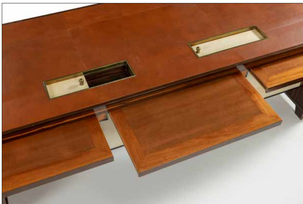
Paul DUPRÉ-LAFON (1900-1971), Rare et important bureau en U renversé à deux caissons et réalisé en placage d'ébène de Macassar. Adjugé 147 200 € le 18/06/21