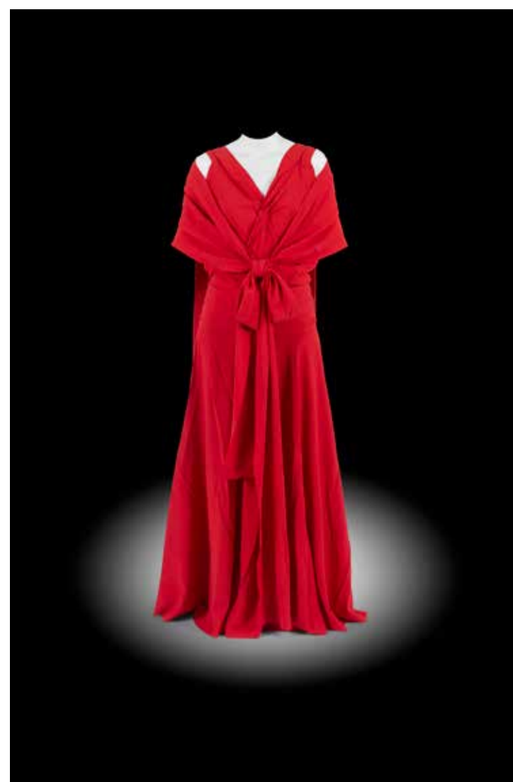
Madeleine VIONNET (1876-1975), Robe longue en crêpe rouge avec son dessous en soie rose, années 30 , dans sa boîte. Adjugé 108 800 € le 03/03/21