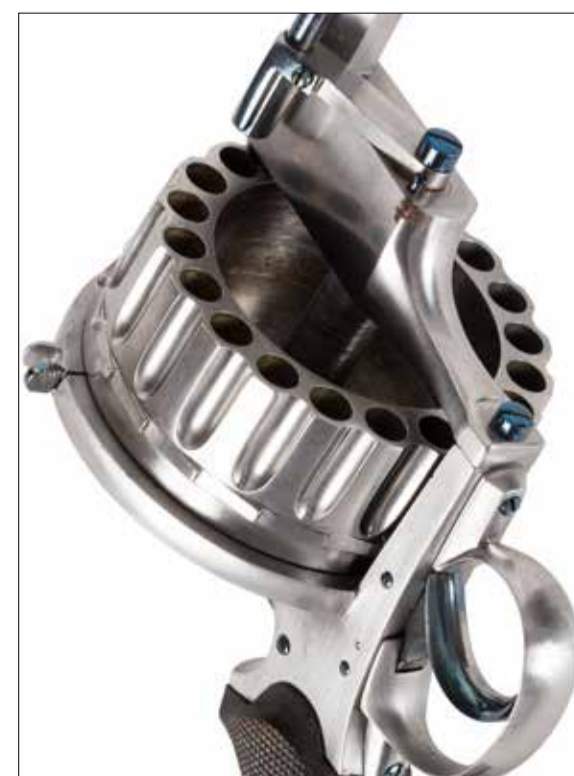
Important revolver à système type « Chainex » à percussion centrale, 20 coups, calibre 7,65. Adjugé 4 736 € le 6/7/21