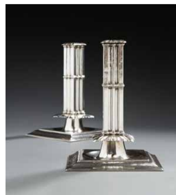
Paire de flambeaux du maître orfèvre Antoine 1er Neyrat, citée en 1683. Clermont-Ferrand 1687 Poids : 693,9 g. Adjugé 243 200 € le 4/02/21

Un très bel ensemble de pièces d'orfèvrerie, rassemblé par le collectionneur Marcel Szejnberg et réalisées entre le XVIème et le XVIIIème siècle, a été dispersé à l'occasion de deux ventes en 2021. Organisées avec les spécialistes Claire Badillet et Édouard de Sevin, elles ont totalisé 3,2 millions d'euros. Cette collection, considérée comme l'une des plus belles constituées entre les années 1970 et 2000, a passionné les amateurs d'argenterie, nombreux à participer à la vente et démontre le savoir-faire de l'étude Ader pour mettre en valeur les collections. Une paire de flambeaux réalisée en 1687 par le Maître Orfèvre Antoine 1er Neyrat, a été récompensée par une adjudication à 243 200 €. Dispersée au mois de Juillet, la collection de céramiques de Jacques Blin, rassemblée par le galeriste Eric Mouchet a enregistré un nouveau record d'adjudication pour une pièce de cet artiste à 14 080 €. La dispersion de la collection de Jacques Crépineau, qui fut pendant près de 40 ans le Directeur du théâtre de la Michodière à Paris a remporté un franc succès en totalisant 823 000 €. Une rare collection d'armes à système, composée de modèles uniques ou produits à très peu d'exemplaires et d'une grande technicité, a fait l'objet de deux ventes et a permis à l'étude de toucher un nouveau marché de collectionneurs.